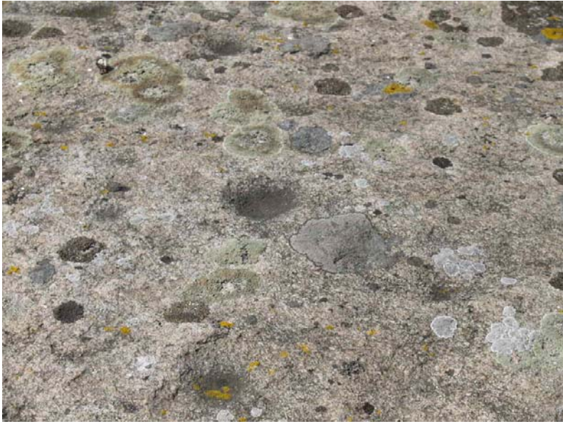
Skålgrubber fra bronzealder